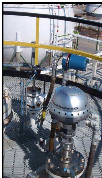
Rys. 1. Radar pomiarowy zainstalowany na zbiorniku

Oprócz pomiarów radarowych, w ofercie ASE jest cała gama innych technik pomiarowych i poziomowskazów do różnych mediów oraz obiektów mniejszych i specjalnych w technologii: pojemnościowej, ultradźwiękowej, magnetostrykcyjnej, impedancyjnej oraz rezystancyjnej.