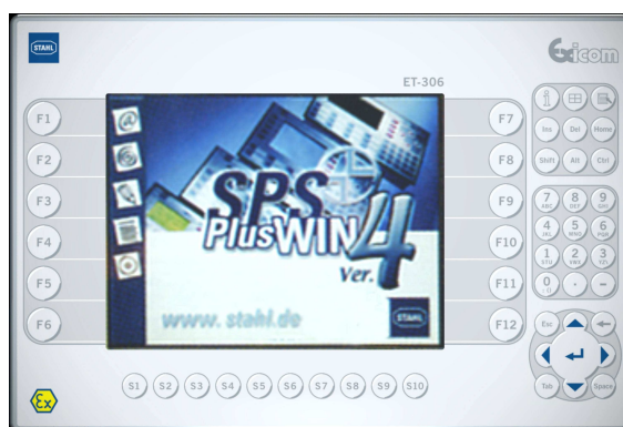
Rys. 3. Panel operatorski dla stref zagrożonych wybuchem R.STAHL