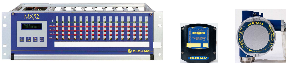
Rys. 2. Centralka do systemu detekcji INDUSTRIAL SCIENTIFIC OLDHAM