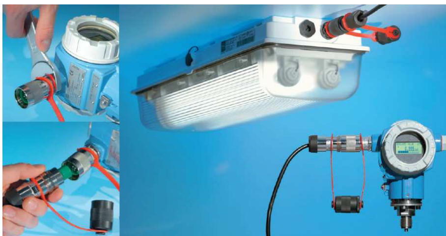
Rys. 4. Oświetlenie i przetworniki pomiarowe z zainstalowanym złączem miniCLIX R. STAHL